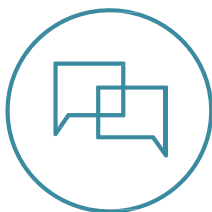
Aukera berdea gunea