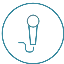
Hitz berdea gunea